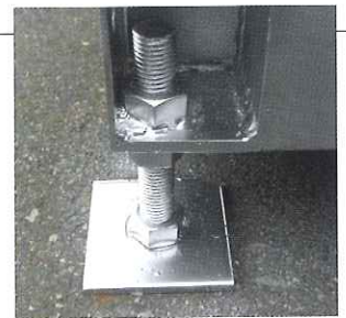
アジャスター部分